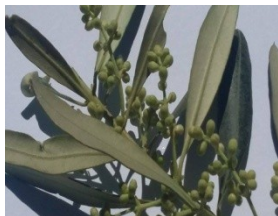
Κρόκκιασμα (στάδιο E)