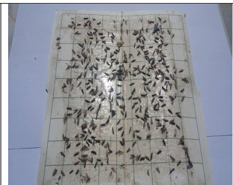
Ακμαία του πυρηνοτρήτη σε παγίδα του ΠΚΠΦ Βολου

Διαπιστώσεις: Η πτήση της ανθόβιας γενιάς του πυρηνοτρήτη βρίσκεται σε εξέλιξη. Οι συλλήψεις των ακμαίων του πυρηνοτρήτη στο δίκτυο φερομονικών παγίδων συνεχίζονται και εμφανίζονται υψηλοί πληθυσμοί του εντόμου στους νομούς Μαγνησίας, Φθιώτιδας και Λάρισας. Αναμένονται εναποθέσεις αυγών και εκκολάψεις προνυμφών στο κρόκκιασμα - αρχή άνθησης.