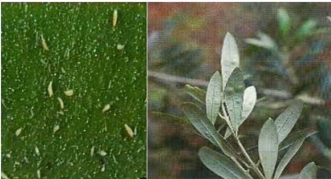
Ακάρεα Προσβολές στα φύλλα από ακάρεα

Διαπιστώσεις: Στους νομούς Μαγνησίας, Λάρισας και Φθιώτιδας τα τελευταία χρόνια παρατηρούνται έντονες προσβολές της νεαρής βλάστησης και αργότερα των ανθοφόρων οφθαλμών και καρπών από τα σκωληκόμορφα ακάρεα.