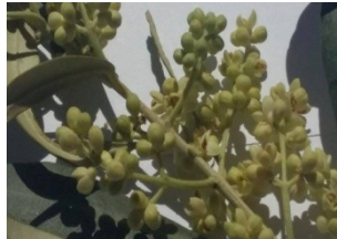
Έναρξη άνθησης (στάδιο F)